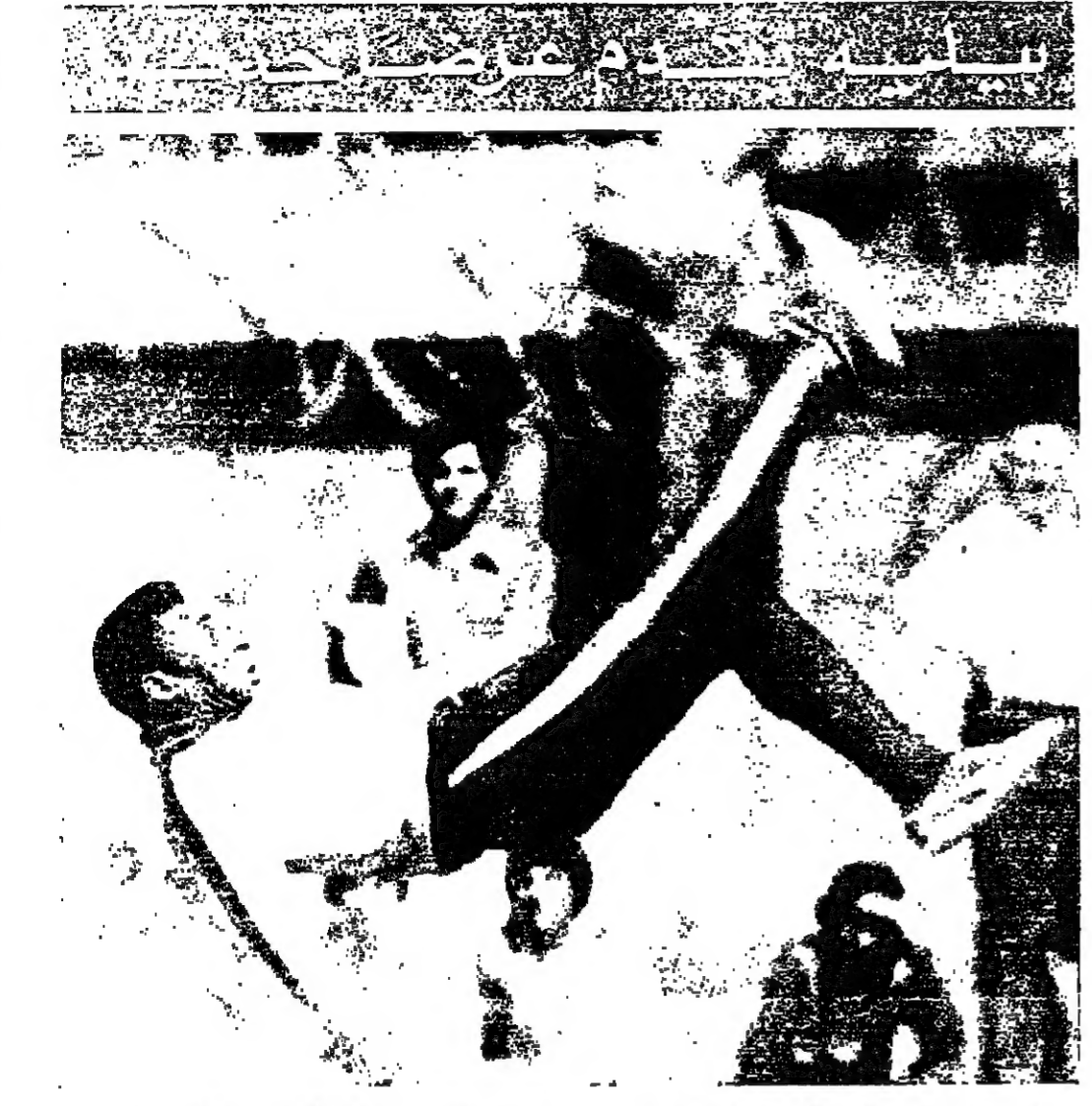
بيدي في قفزة رائمة أثناء العرض الذي تمه على ملعب الجامعة المصرية امس

الولايات المتحدة واسرائيل في كل شيء... اسرائيل تشكو من الضغوط الاميركية وتبدأ حملة معاكسة في واشنطن